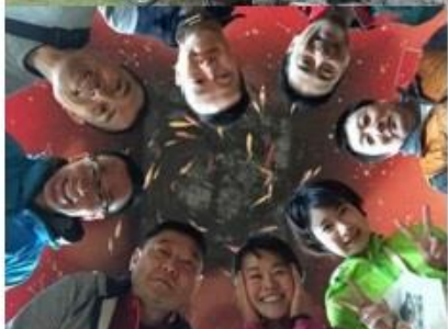
4月27日～29日の「gruppetto・ロードバイクミーティング」には関西や九州からの参加者があった！？

「Go羅漢」では、「やましろ商工会」、「錦川観光協会」、「いわくに里の駅ネットワーク」、そして「サイクル県やまぐち推進協議会」と連携し、「やましろ羅漢スターリジットレイル」や「里の駅巡りサイクリングマップ」をベースに、定期的なサイクリングツアーやミニイベントを企画・運営していきます。