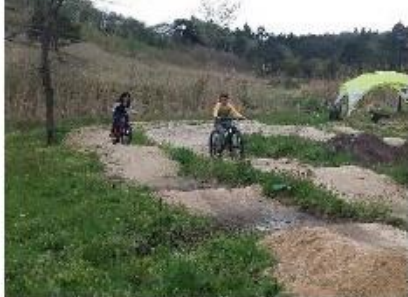
「らかん高原自転車広場」にレンタサイクルベースを設置し、ランニングバイク、BMX、MTBの貸し出しを行う！