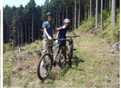
自転車は奥が深い！日常利用とスポーツ利用では、乗り方、扱い方、必要なテクニックが微妙に異なる。8の字走行でパントラックを走るバランス感覚を確認し、練習用Eコースで山道走行のシフトチェンジやブレーキングを体感する！