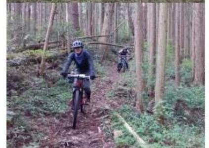
県内のショップからカスタムツアーの依頼があり、定番の柱ヶ瀬&上沼田トレイルに新たな山道を加えて実施！