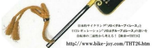
日本のサイクリングソコグループ「レース」とUCIレギュレーション「ソログループレース」の違いを自転車の二面性から考える！【検索⇒THT26】 http://www.bike-joy.com/THT26.htm