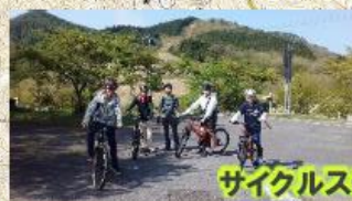
サイクルステーション・らん高原自転車広場